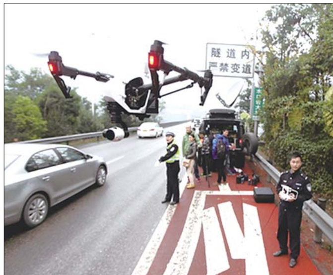
在重庆,交巡警已运用无人机空中抓拍。(资料片)

值得注意的是,除电警抓拍和现场查处外,针对现有执法方式的盲区和不足,高速交警还将利用巡航高度高、通讯距离长、拍摄视角全的无人机高空抓拍高速公路违法行为,提高对违法占用应急车道行为的发现率和打击率。同时,高速交警微博、微信“双微”已开辟违法举报窗口,开展交通违法“随手拍”活动,对群众提供的车辆违法证据及时甄别,对于符合证据要求的要及时录入非现场执法系统。