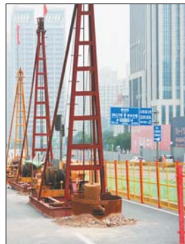
20日,济南轨道交通R3线奥体西路站施工现场。