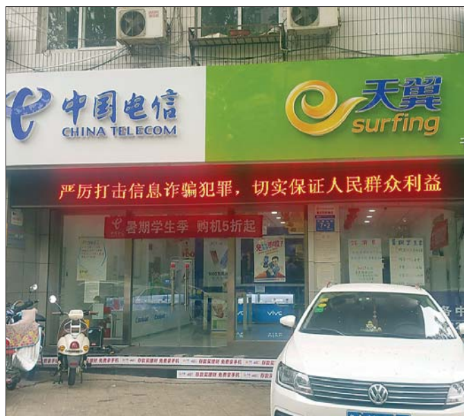
鹿先生去电信营业厅给岳母办卡时，发现岳母名下冒出80多张电信手机卡。