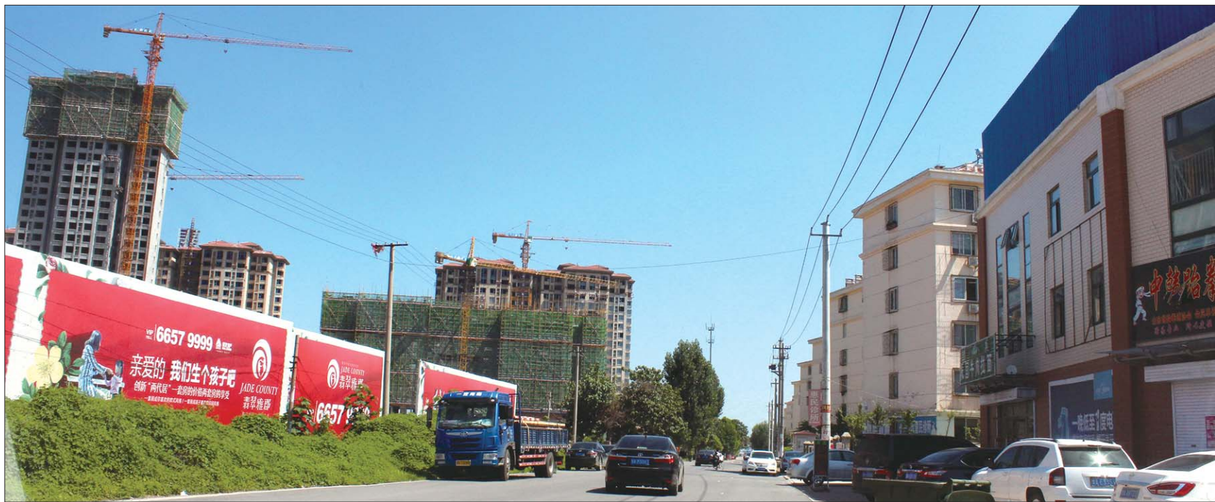
不断崛起的高档楼盘和不断拓宽的马路等配套,孙村片区正在打造产城融合、职住平衡新区。

继去年5月济南市规划局公示了贤文、汉峪和章锦等12个片区控规方案后,今年6月21日,又公布白马山、王官庄、党家、大学园、七贤、美里湖、八里桥、道德街、长岭山、孙村、两河11个片区控规修编方案,并公开征求社会各界意见。其中,涉及到高新区范围的控规方案,有孙村片区和两河片区。这两个片区原先是什么样子?新规划给片区发展描绘了怎样的蓝图?片区未来可预见的发展方向是怎样的?本报记者走访了上述两大片区,为大家详细介绍孙村片区和两河片区的过去,现在和将来。