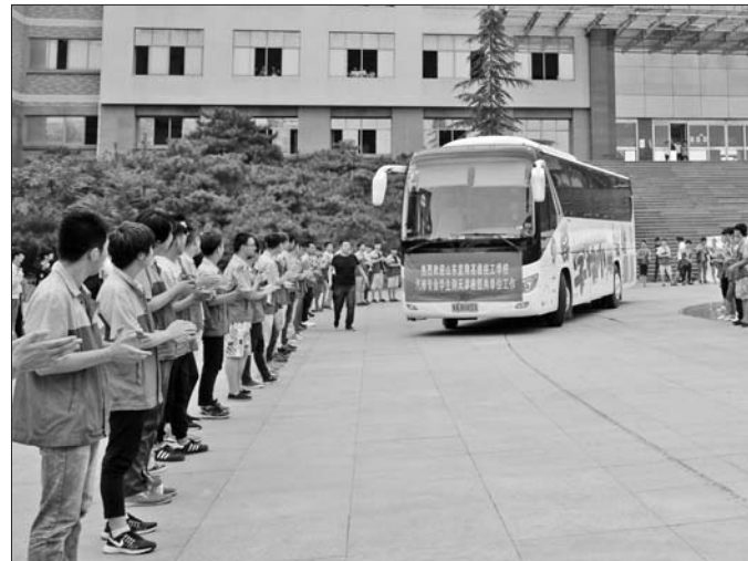
蓝翔技校在校学生列队欢送毕业生。

“除了溢价竞拍,业每招一名学员要向学校交价位不同的就业服务费,从1200元到2000元不等。”许瑞介绍,尽管门槛高,还是有很多业抢着下订单。中,有的是自己慕名而来,有的是由同行推荐,也有一些是从别的业挖了蓝翔学员用着合适,又直接来寻求合作。