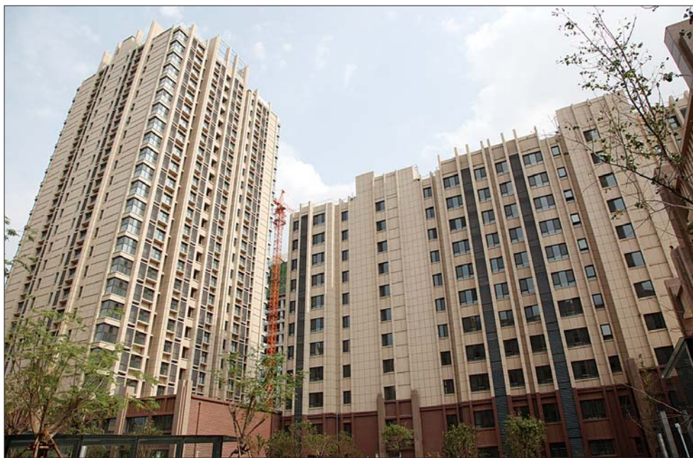
交付给回迁户使用的新楼

作为全区唯一的社协商民主试点街道,旬柳新村街道以健全基层党组织领导的充满活力的基层群众自治机制为目标,坚持“民事、民议、民决”,积极推进基层民主协商