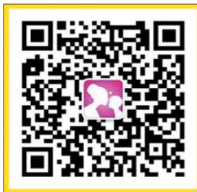
齐鲁孕婴童二维码