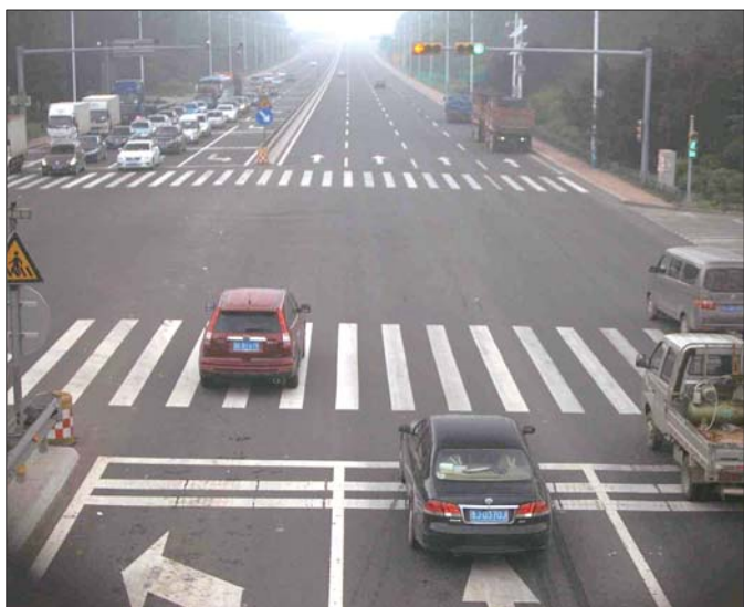
电子警察抓拍到的左转弯道直行违法。

18日,历城交警公布了上半年辖区非现场交通违法抓拍情况,令人没想到的是,违法抓拍次数最多的路段竟然不是闹市区,而是省道103线波罗峪路口到上海街北路段,而抓拍次数最多的违法行为依然是乱道行驶。