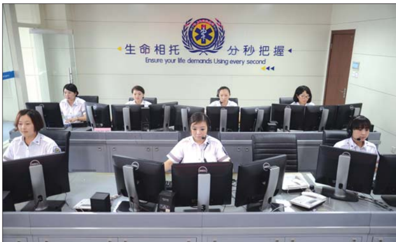
济宁卫生急救调度指挥中心内调度员紧张而忙碌。

提起120，不仅仅是简单的三位数号码，它是人们濒临死亡时出现的希望，是一条名副其实的生命线。在大多数人眼里，120调度员的工作不过是接个电话，派辆救护车。其实，调度工作绝非人们想的那么简单，调度员不仅要具备一定的基础医学知识，还要熟记全市的各个地名；接到假警电话时要细心甄别，接到骚扰电话时要耐心劝导……15日，记者采访了市120调度指挥中心的接线员，听她们讲述坚守生命热线背后的故事。