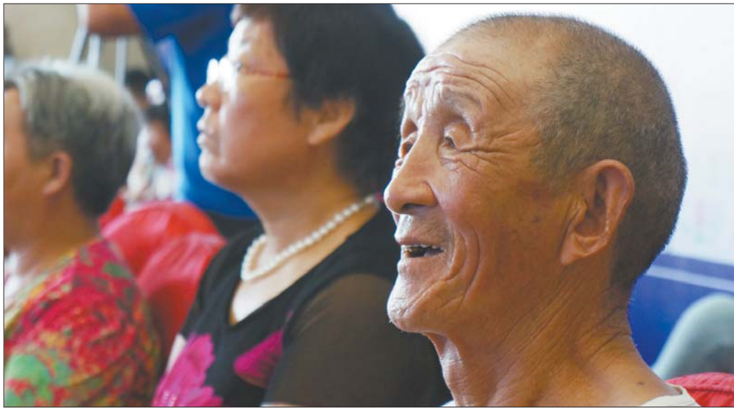
“对话未来家园”活动现场,一位老年市民仔细聆听片区规划。

而以西侧存在不足,且整个片区都没有高中。“教育资源比较失衡,而且教学条件也参差不齐。”