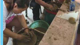
非遗体验月活动现场。记者 杨淑君 通讯员 杨阳 摄

本报聊城8月9日讯(记者 杨淑君 实习生 延玉雪) 自推出至今,中华水上古城非遗体验月活动周周火爆,目前系列活动已经全部圆满结束。