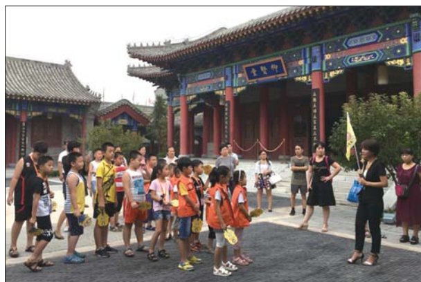
齐鲁乐学少年游古城学书法。

本报聊城8月9日讯(记者 杨淑君) 8月7日,水上古城书法亲子游活动第二期活动圆满结束,同时,小朋友和家长们一起,在游玩中,学到历史知识,感受中国