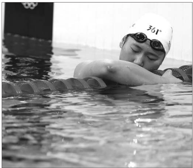
女子200米混合泳决赛，叶诗文只获得第八名。