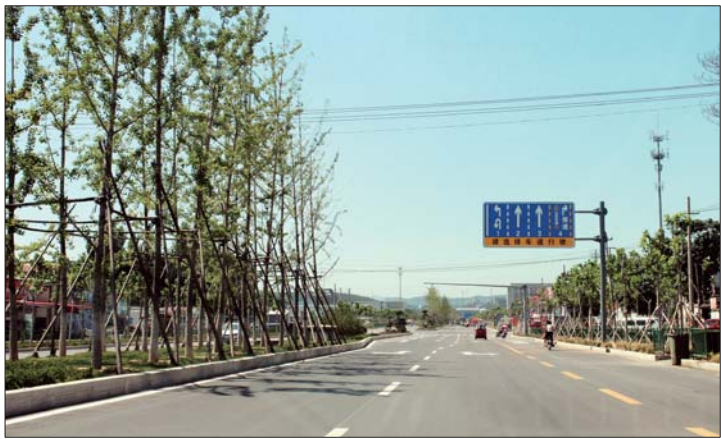
大正路拓宽至50米,建设双向8车道。

编者按: 继去年5月济南市规划局公示了贤文、汉峪和章锦等12个片区控规方案后,今年6月21日,又公布白马山、王官庄、党家、大学园、七贤、美里湖、八里桥、道德街、长岭山、孙村、两河11个片区控规修编方案,并公开征求社会各界意见。其中,涉及高新区范围的控规方案,有孙村片区和两河片区。这两个片区原先是什么样子?新规划给片区发展描绘了怎样的蓝图?片区未来可预见的发展方向是怎样的?本报记者走访了上述两大片区,本期为大家介绍两河片区的过去、现在和将来。