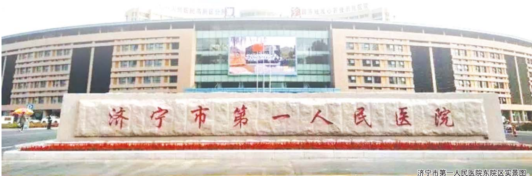
济宁市第一人民医院东院区实景图。

1955年,医院建成1400平方米的门诊楼和1600平方米病房楼。根据卫生行政主管部门的规定,在创建之初,医院还要