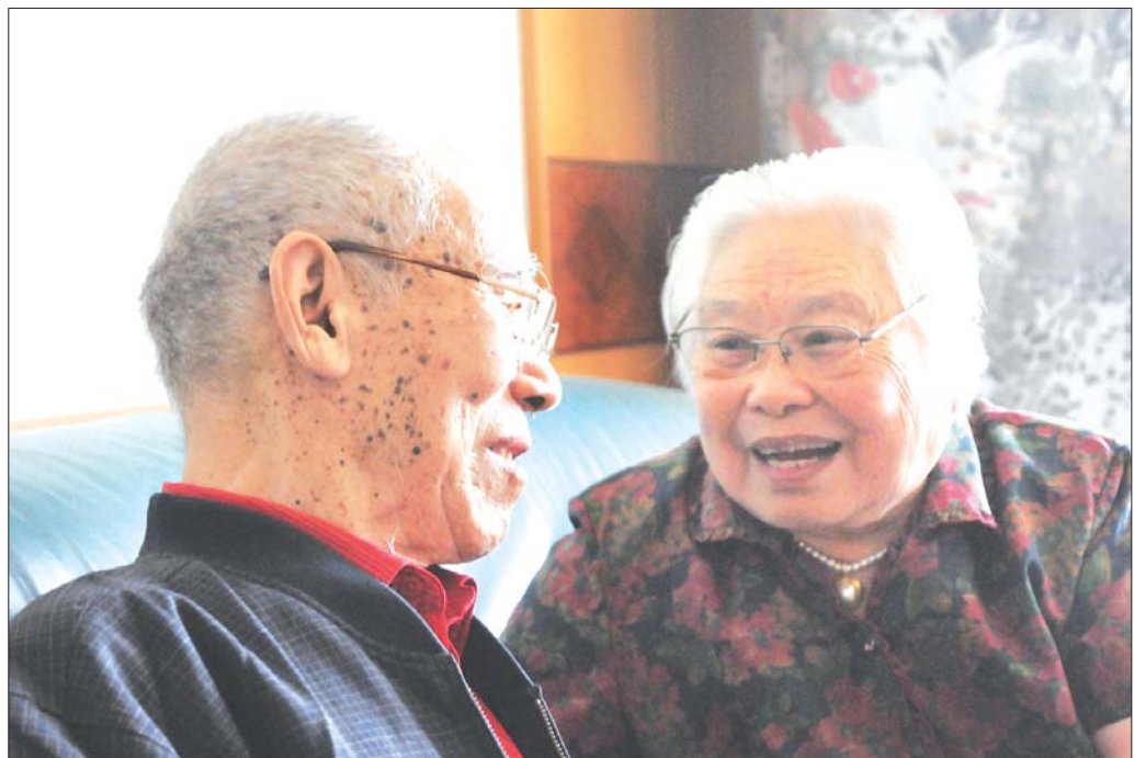
老两口回忆当年的故事。

令他高兴的是,医院的硬件建设也正在迎头赶上。“医院建院早,虽然培养了一大批名老专家,但医院环境不如后来建的医院,东院区启用后,极大地改善了患者的看病就医环境。”作为一名老医务工作者,他虽然人从医院退休了,但心里仍然时时刻刻牵挂着医院的发展。