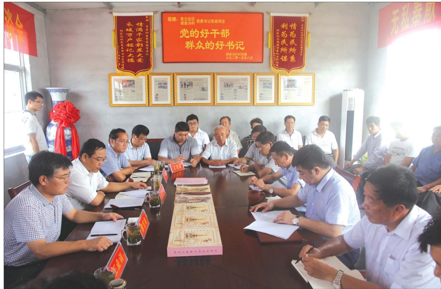
新泰市青云街道派驻胡家沟村第一书记一周年工作总结座谈会召开。