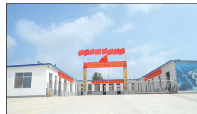
整齐划一，村里有了像样的办公场所。