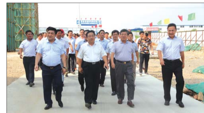
与会领导参观回迁楼建设施工现场。