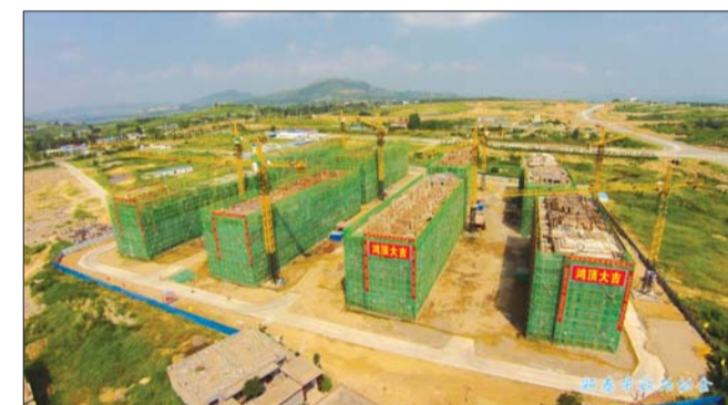
面貌换新颜，胡家沟回迁楼一期工程航拍图。