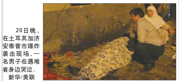
20日晚,在土耳其加济安泰普市爆炸袭击现场,一名男子在遇难者身边哭泣。