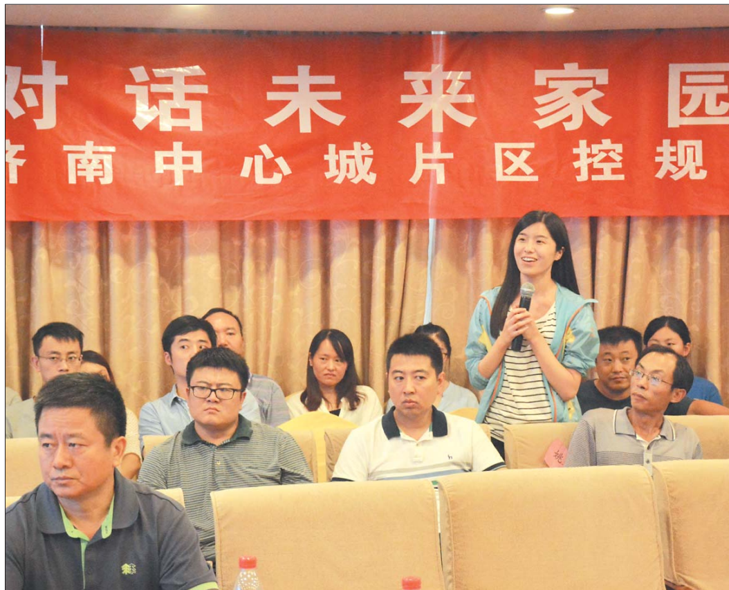
“对话未来家园”活动现场,市民在提问。