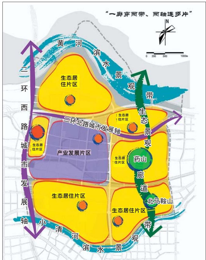
药山空间布局结构。