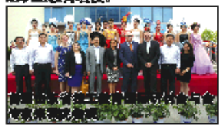
山东省城市服务技术学院与金蓝领培训中心

当前,学院正积极实施“十三五”发展规划。“十三五”期间,学院确立的总体目标是:适应山东半岛蓝色经济区建设,面向现代服务业、先进制造业和战略性新兴产业,联合政府、学校、行业、企业资源,打造“山东、示范全国”的“中国烹饪学府”,增强核心竞争力,带动办学实力、育人质量、管理水平、办学效益全面提升,争创国家级重点技工院校,努力把学院建设成为国内知名、省内一流、特色鲜明的职业教育名校。