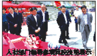
人社部等部门专家来院视察

学院还拥有国家级职业技能鉴定所、山东省首席技师工作站、山东省金蓝领培训中心等,开展社会培训。