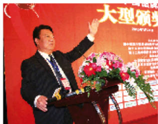
王基林书记参加中国十大知名品牌学校颁奖大会

莱芜技师学院始建于1988年，隶属于莱芜市人民政府，2002年被评定为国家重点技工院校，2013年4月被教育部、人力资源和社会保障部、财政部批准为国家职业教育改革发展示范学校。