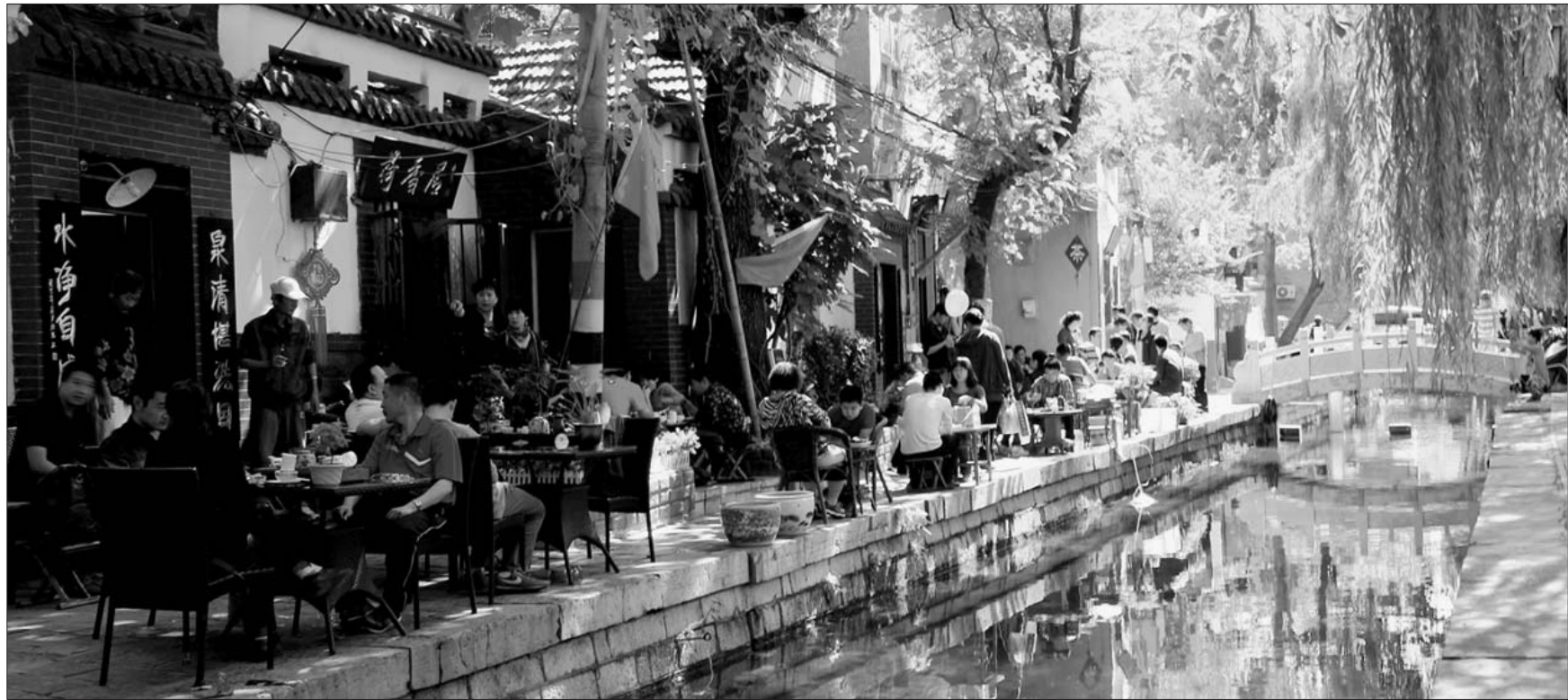
曲水亭街成为市民休闲的好去处。