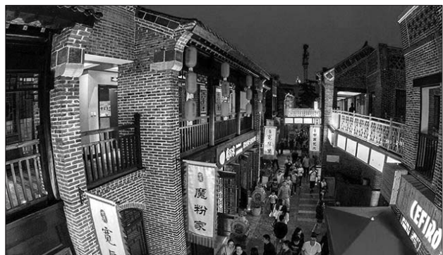
宽厚里是年轻人最喜欢的文化特色街区之一。