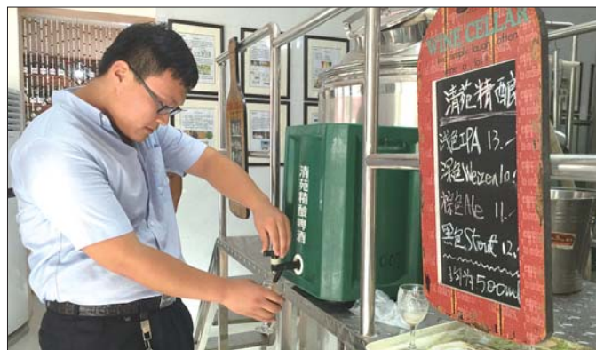
狮子刘村,齐鲁工业大学技术入驻的清苑精酿啤酒。

起,狮子刘成了乡村旅游的“样本”,除了吸引游客游玩,这里还吸引了不少艺术家和企业入驻。