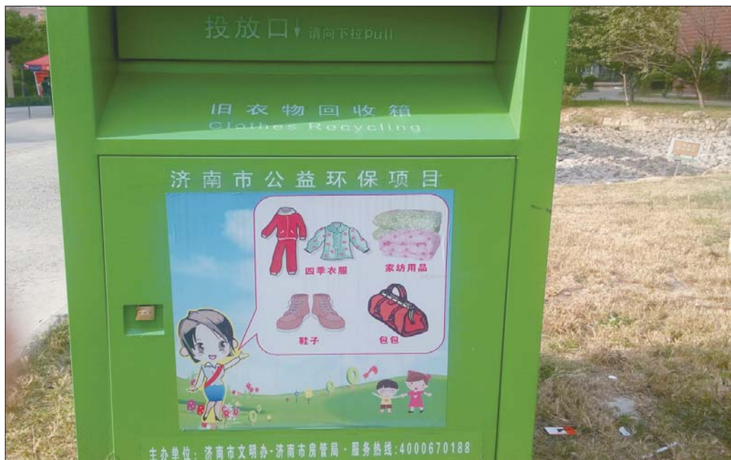
安装在新世界阳光花园的一个旧衣物回收箱。

齐鲁晚报记者注意到,济南衣衣不舍环保科技有限公司是由济南市文明办和房管局监管,济南成刚环保科技有限公司由济南市城市管理局监管,山东顺亿博爱基金则是由济南红十字会来监管,3个企业分别由3个不同的部门监管。