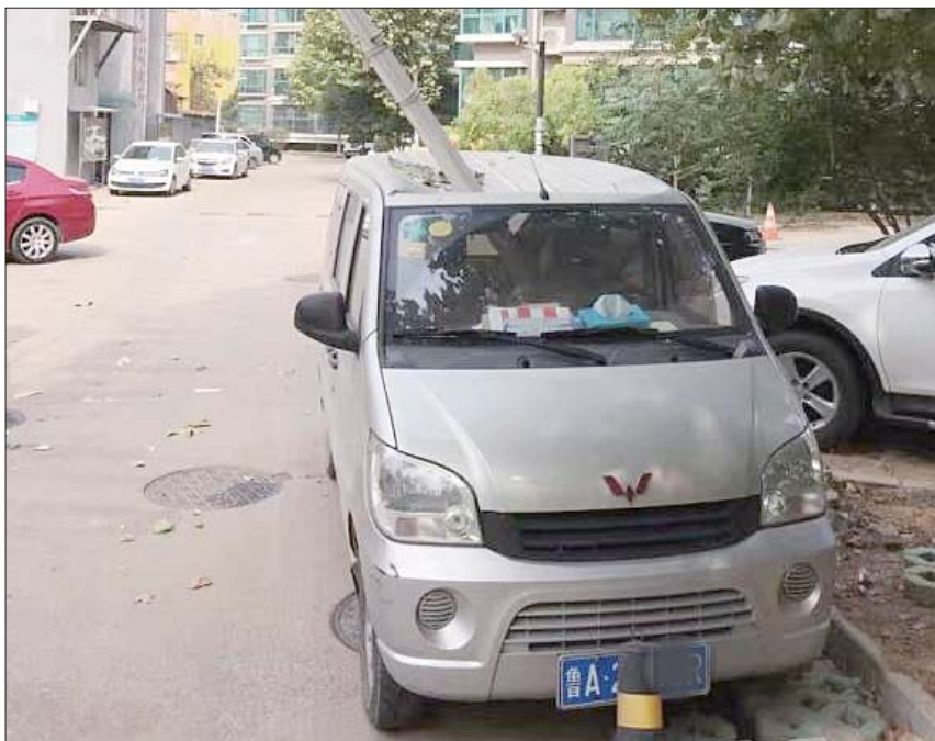
被砸的面包车。

记者看到,脱落的落水管已经断成了好几截,其中一截插在了一辆银色面包车的车顶上,车顶上被砸得凹陷了下去。透过面包车玻璃可以看到,落水管穿透车顶直接插到车里,不过车内并无人员,只