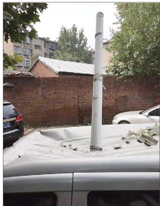
脱落的落水管穿透车顶插进了车里。

至于落水管为何会突然脱落,工作人员表示不清楚,但推测可能是因为时间长了落水管老化。该工作人员称,他们会考虑业主的建议,让工程部的师傅排查小区各个楼房的落水管。