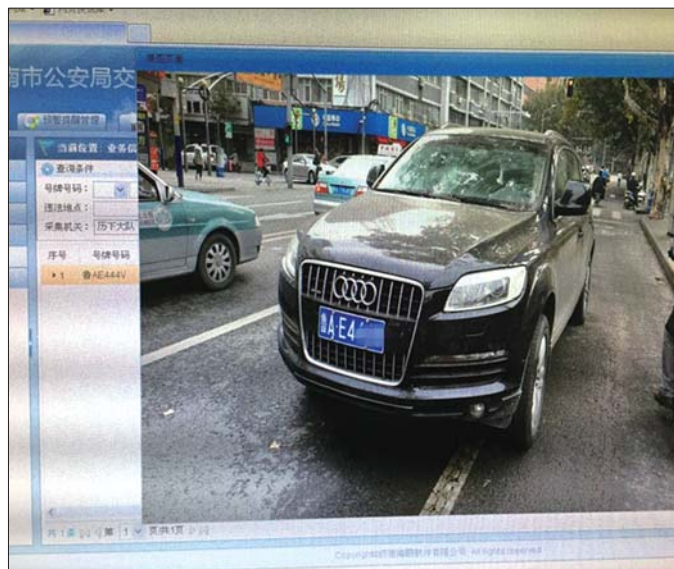
交警现场抓拍的奥迪违停照片。

历下交警相关负责人表示,他们已注意到网上流传的这组照片,对于奥迪车女司机涉嫌轧双黄线调头等其他违法行为,警方也会通过监控探头核查,一经落实一并予以处罚。