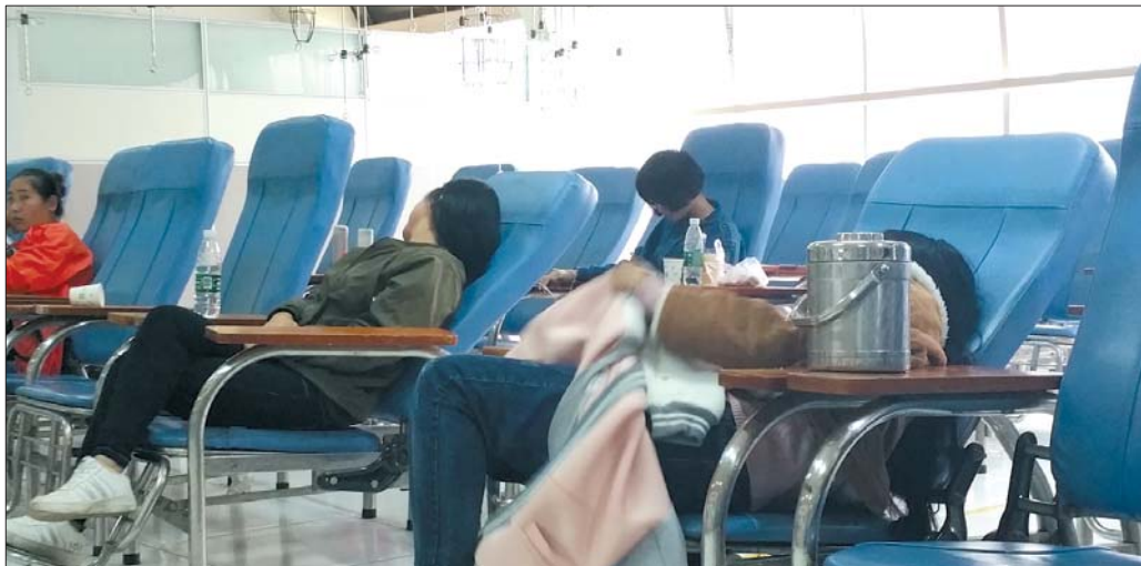
在济钢总医院,生病的学生躺在输液室里。

那么多,“从昨天到今天,生病的学生差不多有20来个,医药二班是最多的一个班,有十来个,但多数班级都没有生病的学生。”耿振云介绍,暂时放假也是根据港沟街道办事处等部门意见采取的措施。