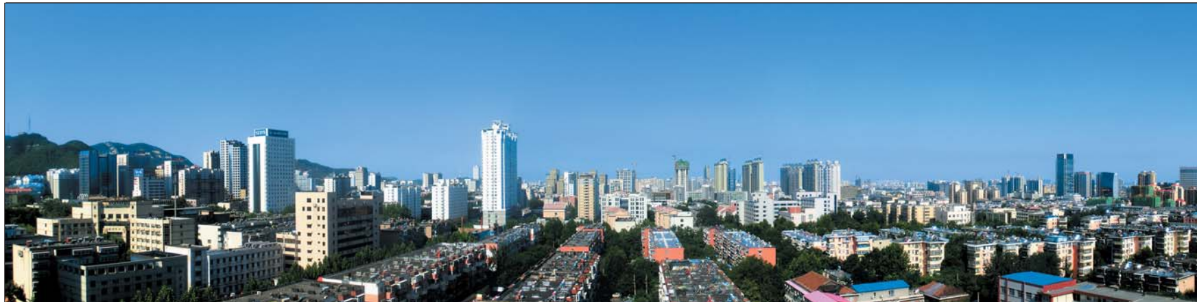
靓丽泉城 吉祥苑社区 高强 摄于吉祥苑小区