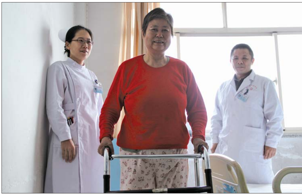
术后几天,高大娘已经可以下床行走。