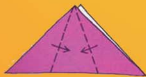
② 沿虚线朝箭头方向折