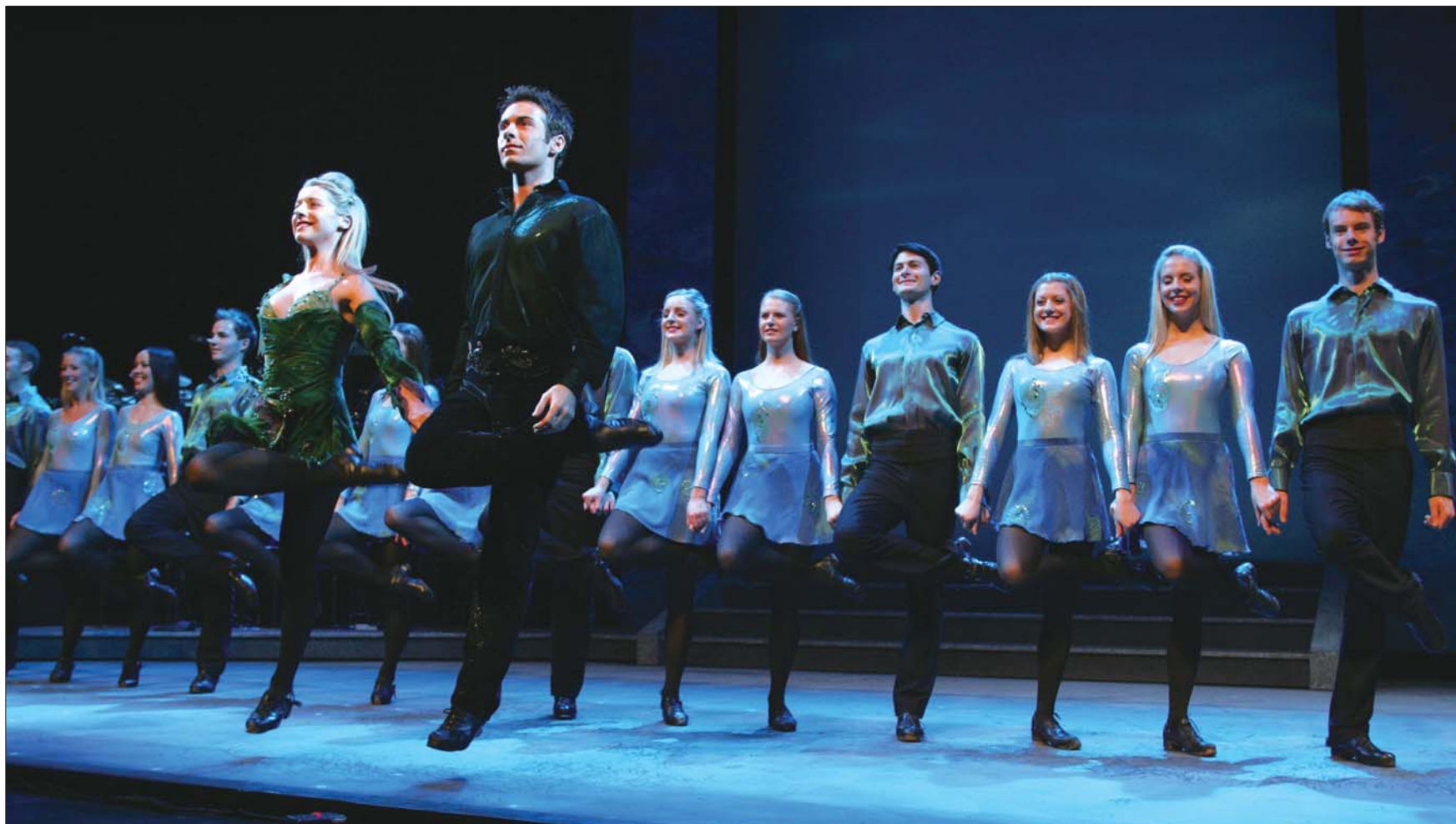
下个月,省会大剧院将上演全球第一舞剧《大河之舞》。