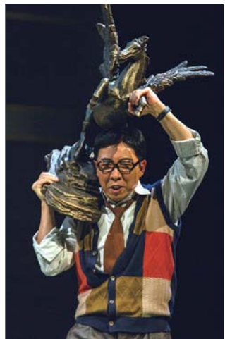
话剧《办公室的故事》。