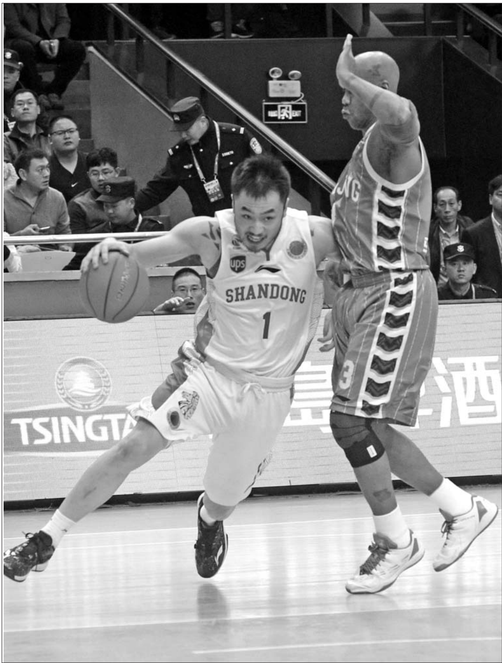
常规赛北京在山东的主场很少尝到甜头,这一次高速男篮将全力以赴继续上演“克星”角色。(资料片) 本报记者 王鸿光 摄