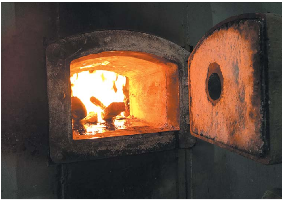
热调试期间,多个锅炉点火。

本报11月5日讯(记者 蒋龙龙) 4日记者获悉,虽然近期温度持续回升,但供暖前的准备和热调试仍在紧张进行中,随着热源的陆续到来,市民家会先后热起来。