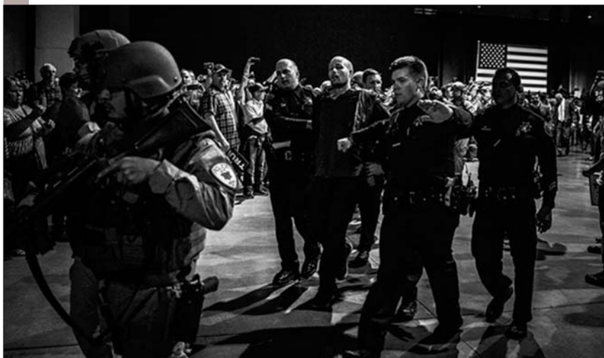
② 特朗普被带离讲台后,特工拘押了在竞选集会现场闹事的一名男子。