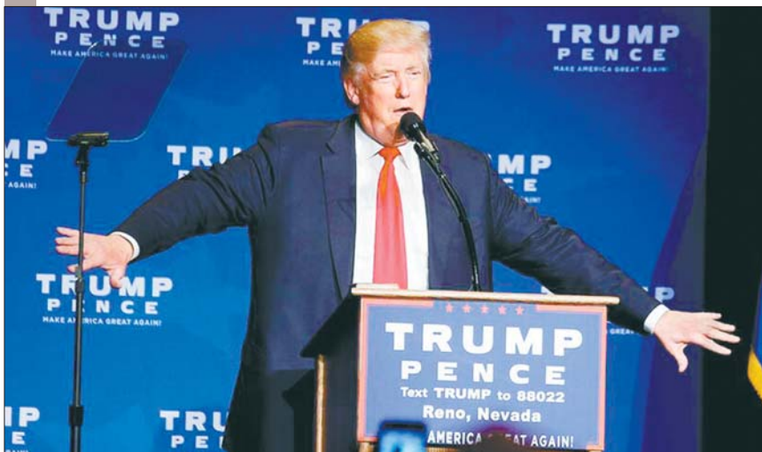
③ 突发事态平息后,特朗普重新回到讲台继续发表演讲,并称赞特工表现“非常出色”。