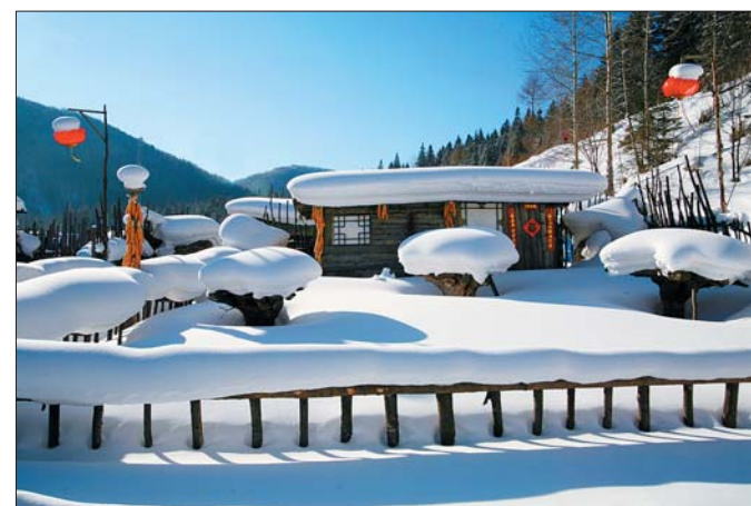
大美雪乡的农家小院