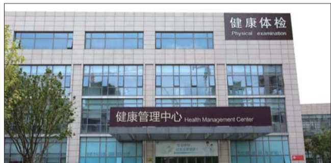
济医附院兖州院区健康管理中心外景。

“我们倡导在健康体检项目选择上,不把有创、有损伤检查项目列为首选。同时,针对一些高发疾病,我们还开展肝纤维化筛查、HRA检查等专项体检项目。”检查中,医院严格落实技术规范,在检后,每天安排专家开展健康咨询与指导,并有专人对重大异常结果随访,真正管理好百姓健康。每年随访有重大异常结果的受检者3000余人次。