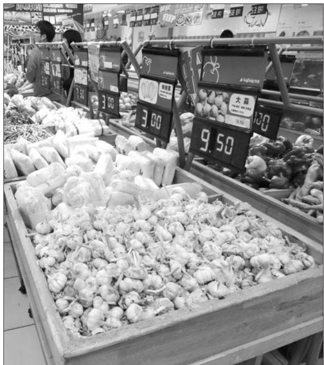
超市内的大蒜价格高达9.5元每斤。

“消费者对大蒜的价格存在误区，自2011年以来，大蒜长时间的低价位运行被消费者视为正常，而把4.5—5.5元/斤正常价格的回归视为炒作，按照目前种植成本、库存成本及考虑贮存企业、收购商、蒜农三方收益来测算，大蒜价格在4.5—6.0元/斤较为合理。”金乡县商务局大蒜产业办公室主任孙海瑞说，大蒜是生鲜农产品，必须低温储存，应区别于其他农产品，而不能简而化之视为囤积行为，贮存企业、收购商和蒜农为利益共同体，蒜农、蒜商、储存商都有收益才能使大蒜产业健康发展，虽然个别储存商低价位采购高价位卖出，确实存在暴利，但并不代表整个大蒜市场行情。