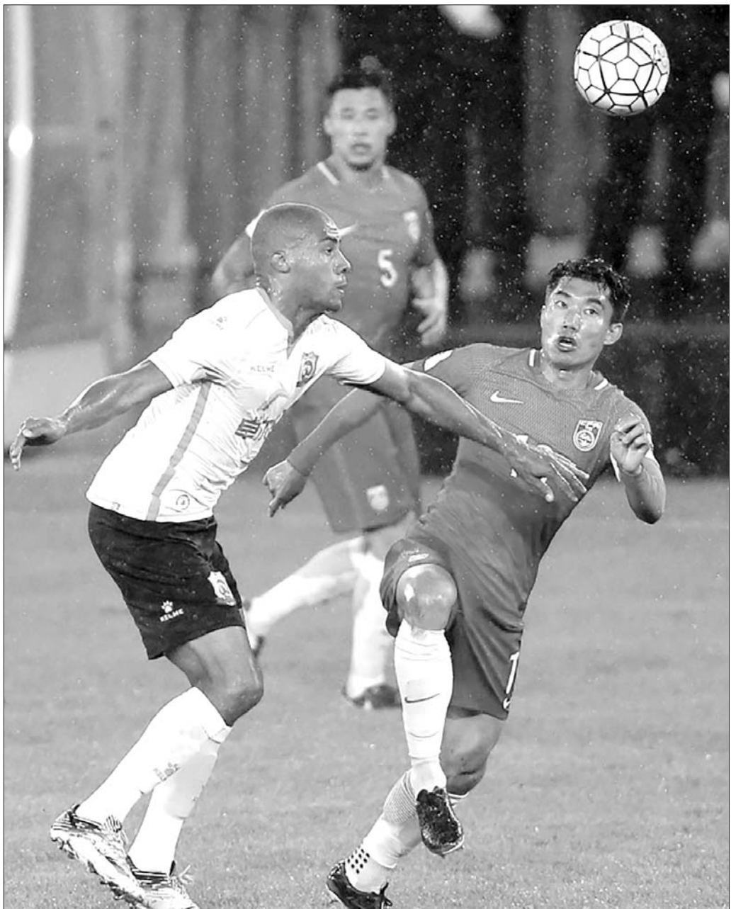
▶国足与武汉卓尔热身,却迎来一场“偷拍门”风波。

现代社会,交流、通讯手段已经发生了巨大的变化,任何一支球队,都没有绝对的秘密可言。以里皮之老练成熟,岂会当着众多媒体记者以及500余名球迷的面,演练自己的看家本领?要知道,他可是出了名的谨慎,无论是在意大利执教还是此前担任恒大主帅,经常是态度强硬地“封闭训练”。这一次,中国队的热身比赛公开进行,摆明了就不会担心被拍、不会担心消息外泄。弄清了这一条,就会觉得所谓的球迷人群“撕裂”毫无意义可言,也许只能归结为大家心里的包袱太重了、对15日这场比赛的期望值太高了。其实大可不必如此沉重,如果说比赛是一出戏,导演是里皮,演员是国脚,我们都是观众,大家各司其责,尽量都别“乱道行驶”,要不然,这戏就不好往下演了。