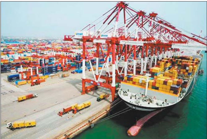
出口疲软，造成顺差收窄，再加上连续多月减持外汇储备，影响了投资者对人民币的预期。（资料片）