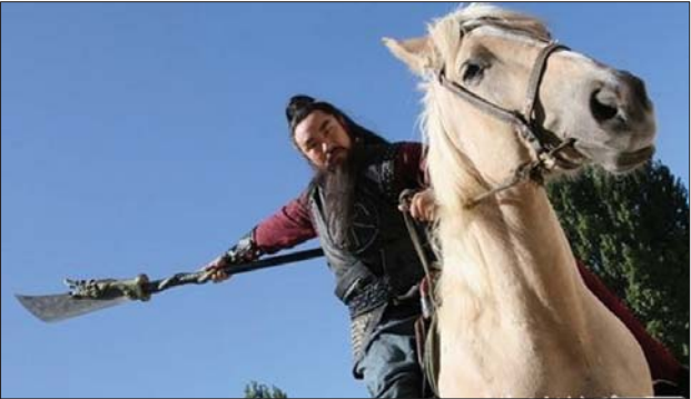
《水浒传》中手持青龙偃月刀的关胜。