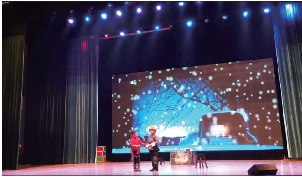
京剧《白毛女》表演现场。

本报济宁11月22日讯(通讯员 王超 刘长森) 为全面贯彻国务院关于加强中小学生美育教育的实施意见,引导广大青少年学生参与丰富多彩的艺术活动,展示学校艺术教育的丰硕成果,11月13日,由山东省教育厅主办的“2016年山东省中小学生校园艺术节戏剧、合唱比赛”在曲阜举行;金乡县选送的三个节目均取得优异成绩。