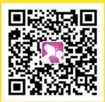
齐鲁孕婴童二维码

活动评选出的最像大宝二宝,将获得主办方提供的一等奖——新款iPhone7手机一部。活动另设置二等奖3名,每人获得价值3000元的奖品;三等奖6名,每人获得价值1000元的奖品;优秀奖10名,奖品价值500元。另外,只要报名参与活动,就可获得参赛礼包一份,包含精美小礼品、儿童摄影券、阿胶糕、洗衣片、抽奖卡等。想不想让你的宝贝也成为万千粉丝关注的“小明星”?那就一起来吧!