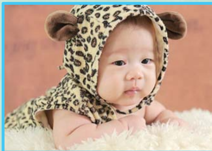
▲编号:16 宝贝姓名:吕明臻 吕佳芮 点评:有心的爸妈,给兄妹俩的百天照设计了同样的造型,你能分得出哪是哥哥哪是妹妹吗?