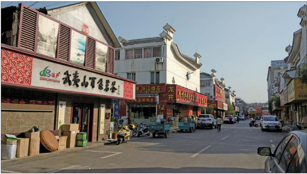
在济南茶叶批发市场,有一百多个店铺要面临着拆除。

近半年来,一直流传着茶叶批发市场因为轨交建设要拆迁的消息,传言最终变成现实,拆迁范围在10月底正式公布。虽然只拆除茶叶市场的部分区域,市民买茶不会受太大影响,但对于待拆迁的商户,未来的生活却突然变得迷茫起来。