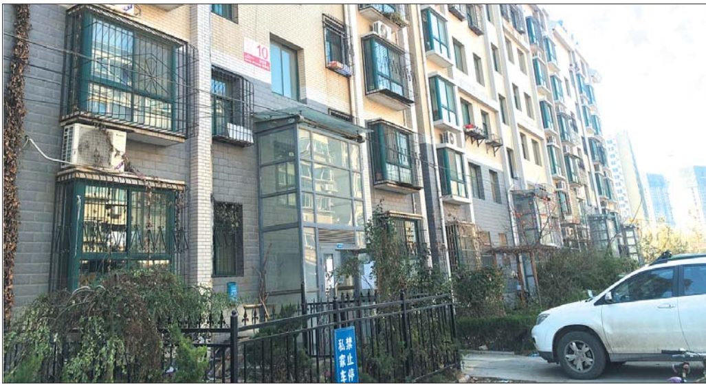
一户一表改造遇难题的舜承苑西区10号楼。

“售房单位没钱,我们自己钱却不收。”近日,家住舜承苑西区9、10号楼的业主们十分着急,由于两栋楼的售房单位无法出资进行“一户一表”改造,业主家中即将停电。对此,供电部门表示,根据相关文件,一户一表改造无法接受个人申请;售房单位表示,将尽快筹资。