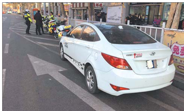
前后车牌都被对折。