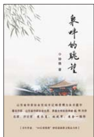
《泉畔的眺望》 钟倩 著 中国文史出版社

她因为出色的劳动和动人的情怀,已经获得了许多世俗的赞誉和奖励,但在我看来这还远远不够。她应该更多地被他人关切,其中最重要的就是走进她的心灵世界,最好的方法就是深入阅读她一笔笔写下的这些文字。她获得过第六届万松浦新人文学奖,这个奖是面向全部华语写作者的;“新人”二字也不是指青年作者的意思,而是指作品的新境界和新高度。可见她的作品已经获得了极高的赞赏和肯定。她的文字流畅如水,最为难能可贵的是饱含了生命的激越感情。这种激越有强大的感染