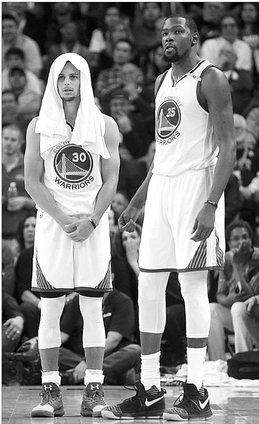
火箭勇猛,勇士少了拿手活,两个加时后也只能自吞苦果。

本报讯 北京时间12月2日,休斯敦火箭和金州勇士大战双加时,火箭客场终以132:127凯旋,也终结了勇士的十二连胜。主场作战,勇士败因何在?