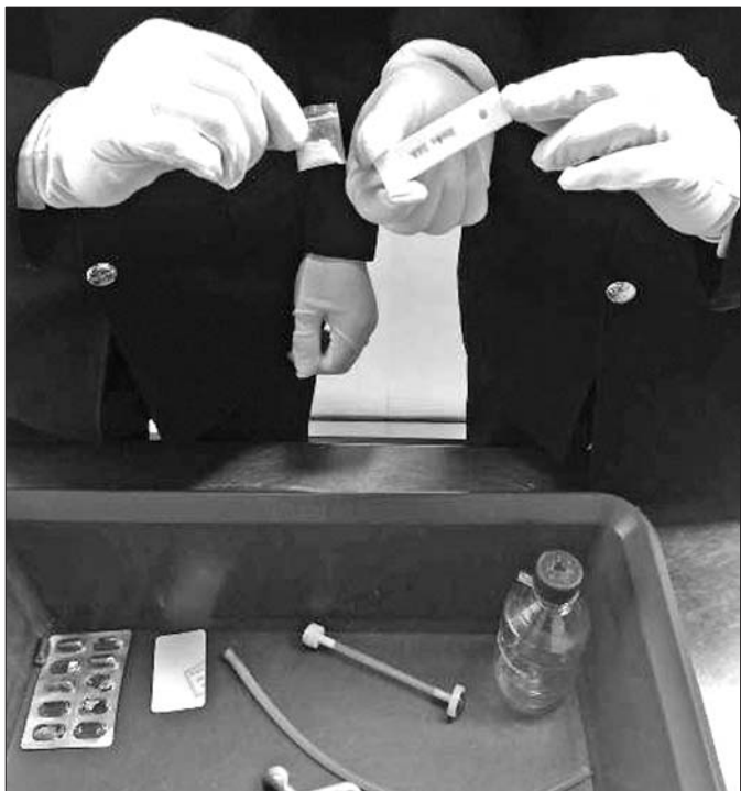
海关查获的冰毒及吸毒用具。 本报记者 潘旭业 通讯员 苏亮

将毒品装进避孕套藏体内企图混入境被查获，携带15斤多黄金制品入境被查获，违规携带29枚古币出境被查获……12月6日，青岛流亭机场海关公布10起2016年查获的走私案件，走私物品种类繁多，走私手段五花八门。