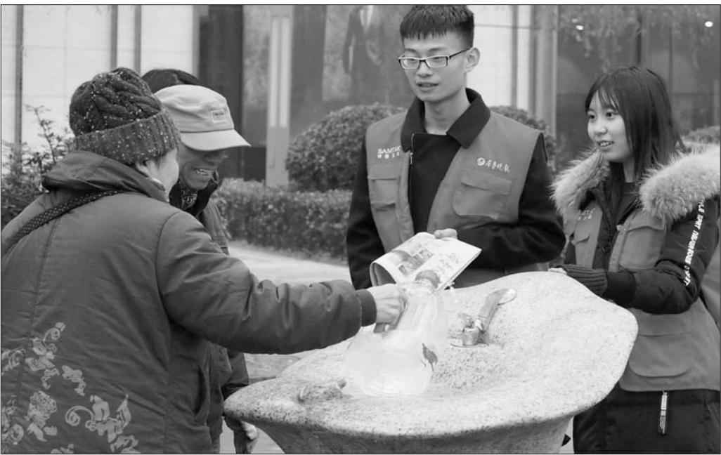
12日，志愿者走上街头，劝说打水者不要长时间占用直饮点。

水的不文明行为，但还存在居民大量取水的现象。 对此，历下区将采取措施，维护直饮点用水秩序。一是呼吁市民在泉水直饮点取水时，不大量取水，自觉遵守公共秩序和社会公德。二是继续加大劝阻力度，组织有关部门工作人员和志愿者，对大量取水的现象进行劝导。三是对于仍大量取水的，将组织公安、城管执法等相关部门，根据有关法律法规，联合对此行