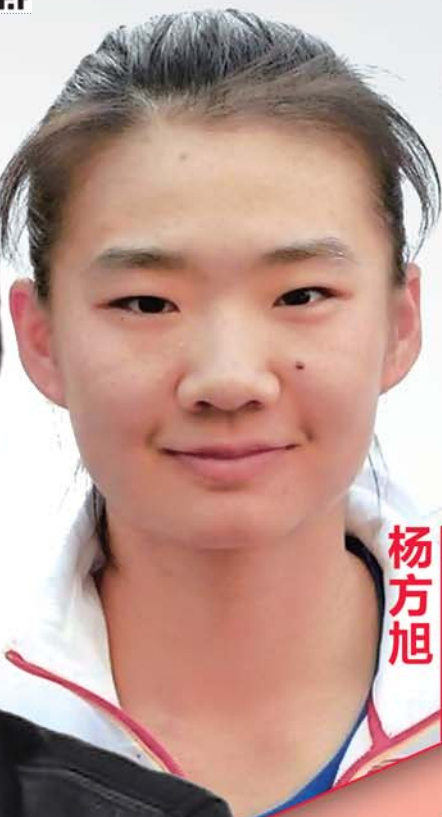
中国女排队员 杨方旭