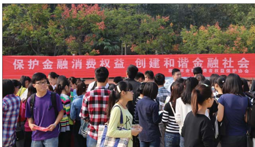
“金融知识进校园”集中宣传活动