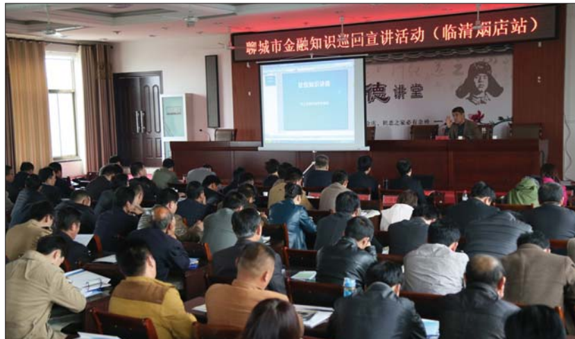
聊城“金融知识巡回宣讲”走进中国轴承大市场-临清烟店镇