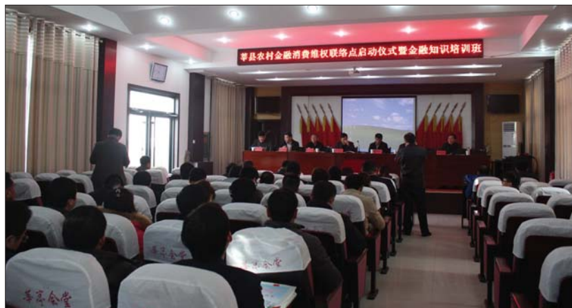
聊城市首家农村金融消费维权联络点在莘县挂牌成立