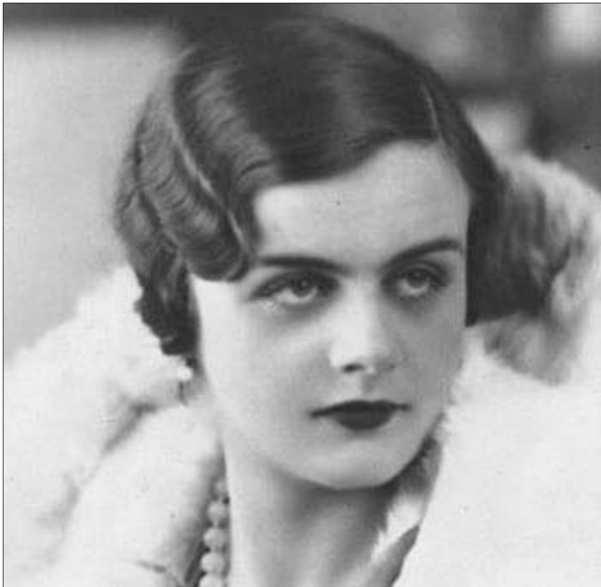
1932年,年仅21岁的克莱尔·霍林沃思。(资料片)