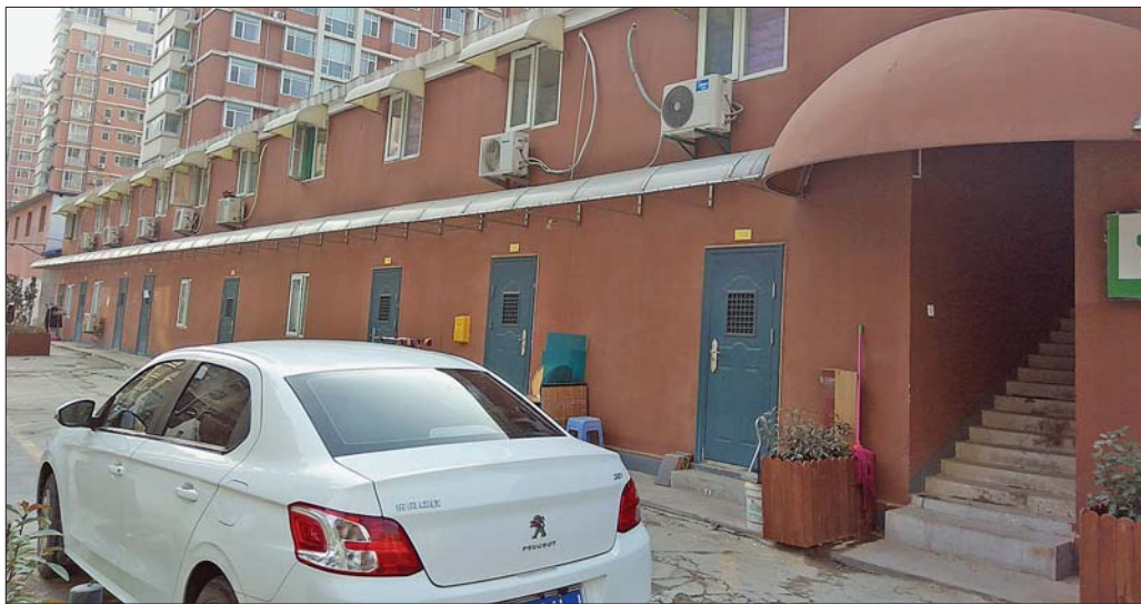
正大城市花园的废弃板房,部分已经被出租。

一位租客告诉记者,他每个月的租金为900多元,租了二层的单间住房,面积在二十多个平方。据该租客介绍,二楼的房间相对贵一些,“同样面积的